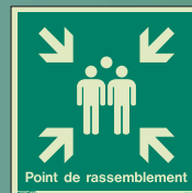
F40499 Q = 300 x 300mm