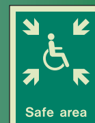
F40499 D = 200 x 150mm