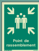
F40497 D = 200 x 150mm

Panneaux de point de rassemblement Tout le personnel doit être compté après une évacuation. Un point de rassemblement désigné aidera les responsables à vérifier le personnel avec rapidité et efficacité.