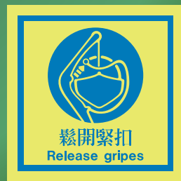
CH519 C (150 x 150mm)