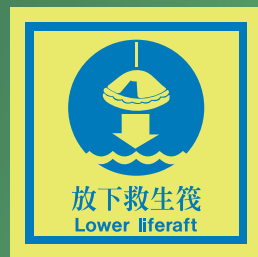
CH514 C (150 x 150mm)