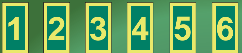
IMO4621 P IMO4622 P IMO4623 P IMO4624 P IMO4625 P IMO4626 P IMO4621 G IMO4622 G IMO4623 G IMO4624 G IMO4625 G IMO4626 G