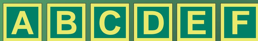
IMO4871 A IMO4872 A IMO4873 A IMO4874 A IMO4875 A IMO4876 A