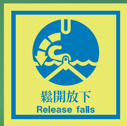
CH516 C (150 x 150mm)