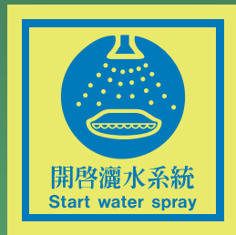
CH517 C (150 x 150mm)