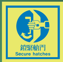
CH511 C (150 x 150mm)