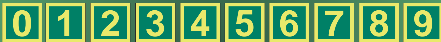
IMO4620 A IMO4621 A IMO4622 A IMO4623 A IMO4624 A IMO4625 A IMO4626 A IMO4627 A IMO4628 A IMO4629 A