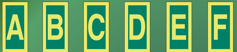
IMO4871 P IMO4872 P IMO4873 P IMO4874 P IMO4875 P IMO4876 P IMO4871 G IMO4872 G IMO4873 G IMO4874 G IMO4875 G IMO4876 G