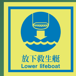
CH513 C (150 x 150mm)