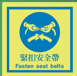
CH510 C (150 x 150mm)

註：下列指示牌的排列次序並不代表事件發生的先後次序，一切安排均需視乎船上之救生艇及下水裝置種類而定。