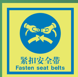
CHS510 C (150 x 150mm)

注：下列指示牌的排列次序并不代表事件发生的先后次序，一切安排均需视乎船上之救生艇及下水装置种类而定。