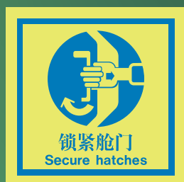
CHS511 C (150 x 150mm)