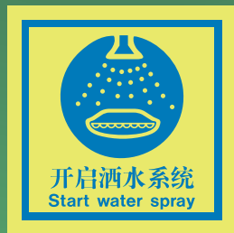
CHS517 C (150 x 150mm)