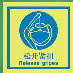
CHS519 C (150 x 150mm)