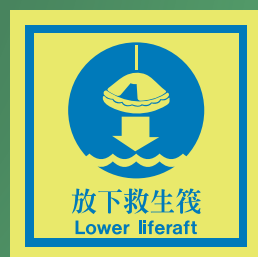
CHS514 C (150 x 150mm)