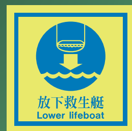
CHS513 C (150 x 150mm)