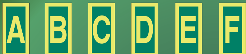
IMO4871 P IMO4872 P IMO4873 P IMO4874 P IMO4875 P IMO4876 P IMO4871 G IMO4872 G IMO4873 G IMO4874 G IMO4875 G IMO4876 G