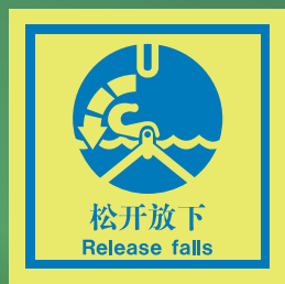
CHS516 C (150 x 150mm)