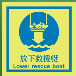
CHS515 C (150 x 150mm)