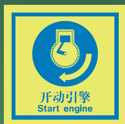
CHS512 C (150 x 150mm)