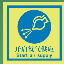
CHS518 C (150 x 150mm)