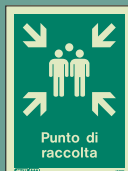
I418 D = 150 x 200mm

Dopo l'evacuazione del personale si dovrà procedere alla sua verifica numerica. Un punto di raduno stabilito agevolerà i responsabili nella rapida ed efficace effettuazione del controllo.