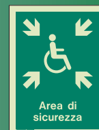
I429 D = 150 x 200mm