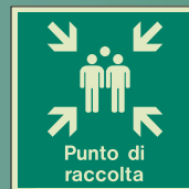
I418 Q = 300 x 300mm