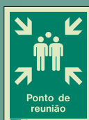
PG434 D = 150 x 200mm

Todo o pessoal deve ser contado depois da evacuação. Este ponto de ajuntamento irá ajudar a administração a identificar o pessoal mais rapidamente e eficientemente