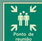
PG435 Q = 300 x 300mm