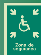
PG440 D = 150 x 200mm