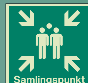
SW41449 Q = 300 x 300mm