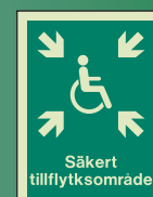
SW41451 D = 200 x 150mm