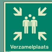
D42112 Q = 300 x 300mm