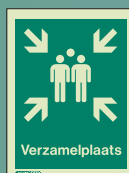
D42112 D = 150 x 200mm

De aanwezigheid van al het personeel moet worden gecheckt na een evacuatie. Een aangewezen verzamelpunt helpt managers om aanwezigheid van al het personeel effectief en snel te kunnen verifiëren.